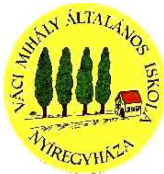
Váci Mihály Tagintézmény