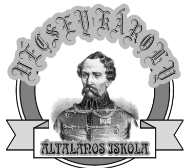
Vécsey Károly Tagintézmény