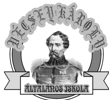
Vécsey Károly Tagintézmény