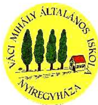
Váci Mihály Tagintézmény